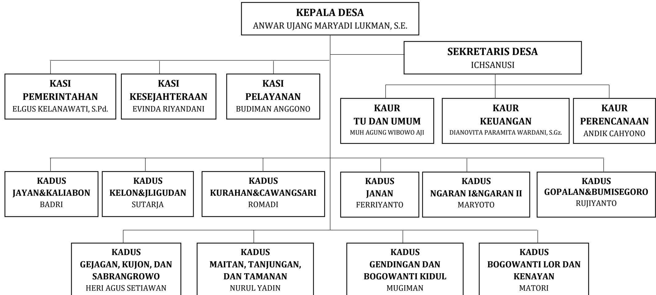
Gambar 4. Bagan Struktur Organisasi dan Tata Kerja Pemerintah Desa Borobudur