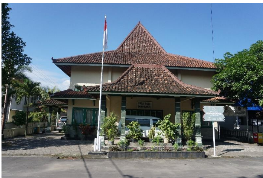
Gambar 1. Kantor Balai Desa Borobudur

Kantor Kepala Desa Borobudur terletak di Jalan Samaratungga 21, Kavling Jayan, Borobudur. Kantor ini memiliki jarak tempuh sekitar 2 km dari Kantor Kecamatan Borobudur dan 3 km dari Kantor Kabupaten Magelang.